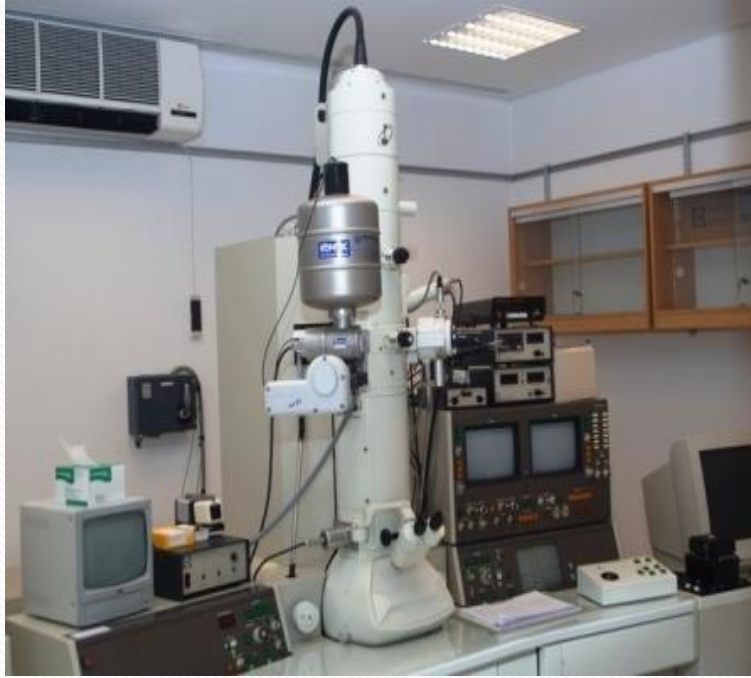
ب. المجهر الإلكتروني المساح