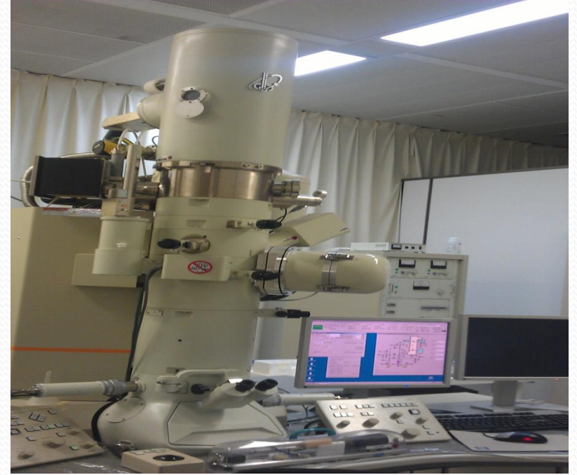
أ. المجهر الإلكتروني النفاذ

قوة التكبير تصل إلى ٥٠٠٠٠٠ ( نصف مليون ) مرة